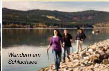
Wandern am Schluchsee