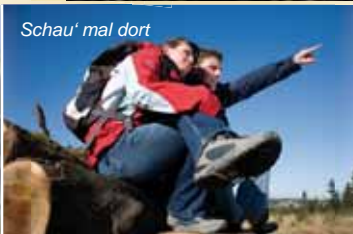
Schau' mal dort